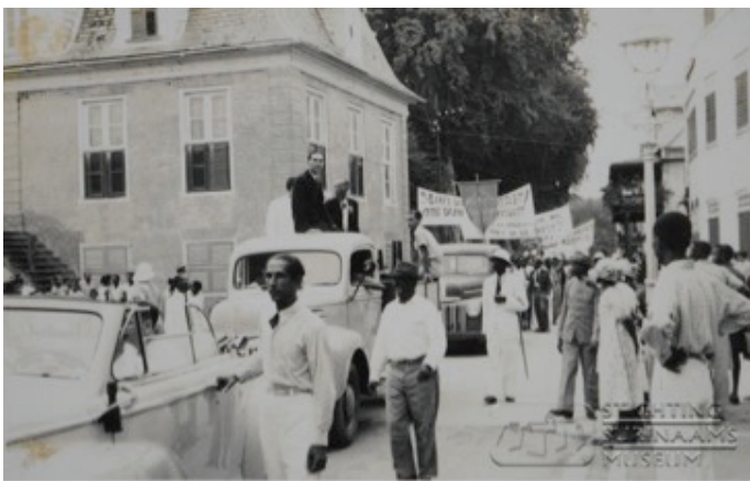
Demonstratie voor zelfbeschikkingsrecht, 1948, midden in auto WBV.

Uit de doos met de nalatenschap van Bos Verschuur komt ook een aantal foto's te voorschijn die demonstraties in 1948 in beeld brengen. Bos Verschuur moet daar grote betrokkenheid bij hebben gehad, want ze waren georganiseerd tijdens het bezoek van een parlementaire commissie uit Nederland die zich kwam oriënteren op het gebied van staatkundige vernieuwingen binnen de verhoudingen van het Koninkrijk. En in ieder geval reed hij voorop bij de demonstratie.