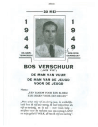
pamflet met tekst over bloem en dolk