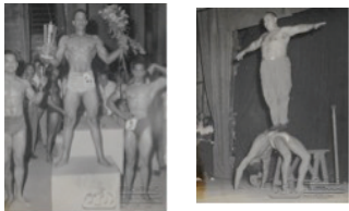
Bodybuilderswedstrijd in de jaren 1930-1940