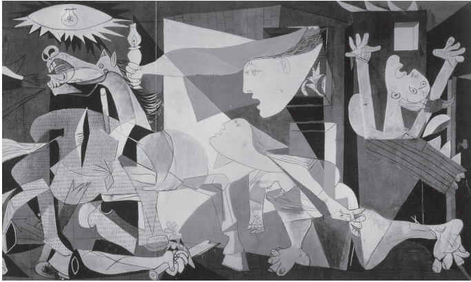
Guernica van Pablo Picasso, 1937