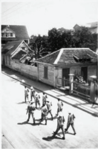
Paramaribo 1933 Patrouille (links) en (rechts) demonstranten zoeken bescherming tegen de schietende politie tijdens de onlusten rond Anton de Kom.