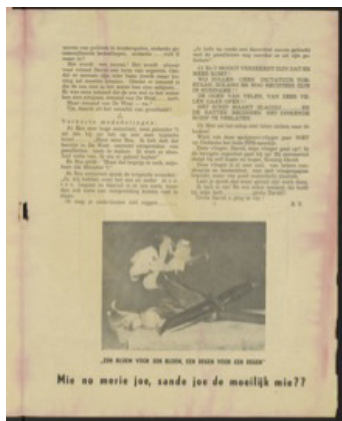
Pamflet 1952 met stil leven dolk en bloem